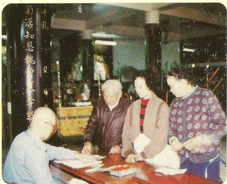
▽經過磅秤、人人均等。