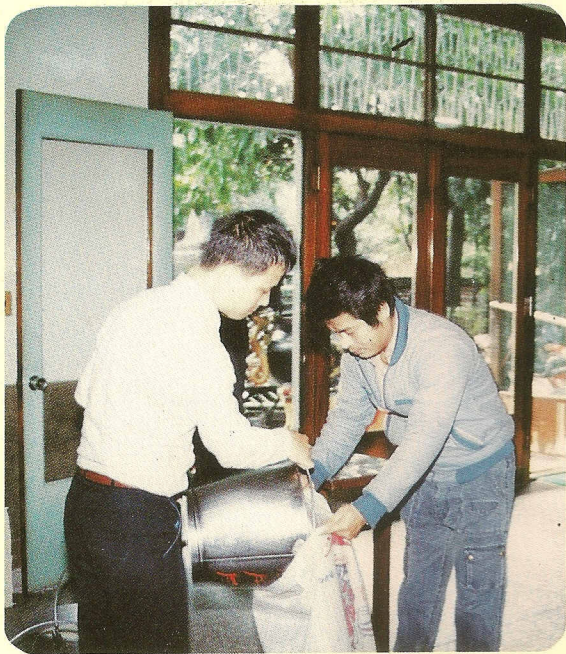
△慈善是最好的服務業。

一貫道是生活的道，祂以教育啓迪人類的智慧，以慈善圓成同胞的愛心。基礎人亦抱此志業，拳拳服膺，故於年節前，道場