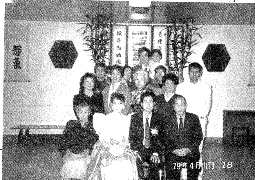
▽家屬合攝於天青中堂。

林前輩感謝著 上天特別地眷顧，以及張老前人的成全，他希望各道場能夠互相的合作，如請壇經所云：遇善相助，遇事相辦；學習觀世音菩薩無分別之心。並希望總壇興建以後，設立「專員」，供給基本生活所需，讓他們能全心全意地去講道、辦道。更希望年輕人能夠趁著青春時代，多替