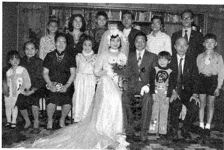
▽林前輩三子結婚時全家福照。

開朗的林前輩，侃侃而談，有好多好多的故事與經驗，限於時間，無法一一道盡，但對天恩師德的那份感激之情，不時流露於言談之間。讓我們謝謝林前輩更祝福林前輩！