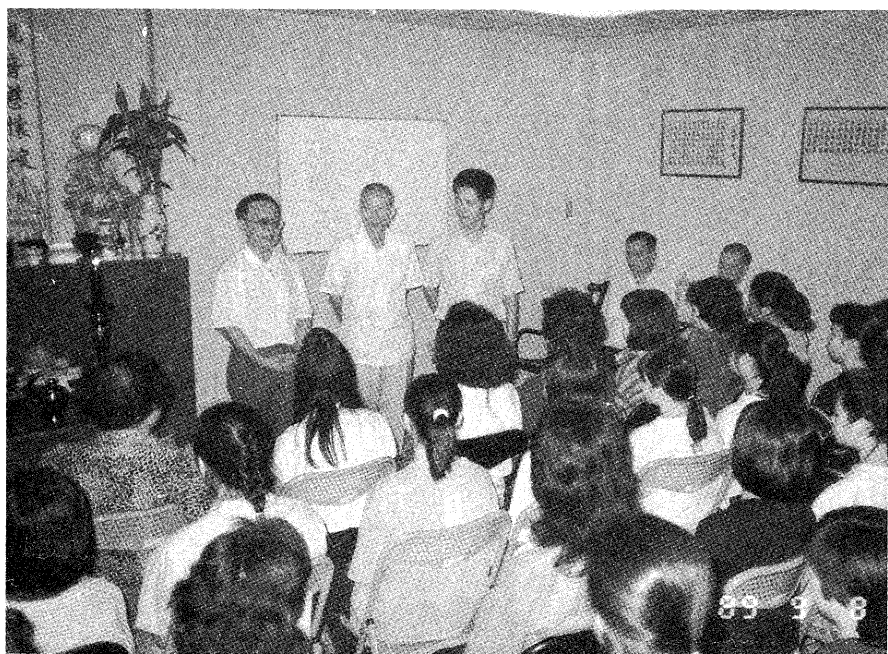
△林前輩視訪泰國道務情形

民國四十一年領命後，與陳茫前輩共同為聖業而奔忙，白天照顧工廠的生意，晚上則開班成