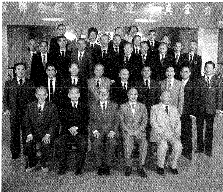
▽ 林前輩（二排左四）與前人及經理們合影