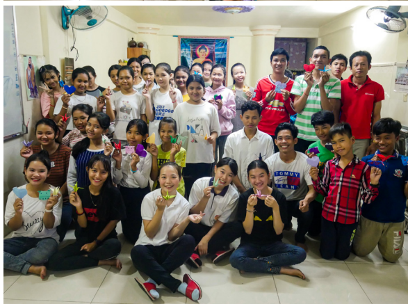
▲ 柬埔寨啟化講堂中文班合影。