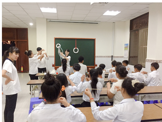
▲ 疫情前，台灣的青年人才前往啟化道院教學。

後學基本上每次都會先複習上週學習內容，藉以加強記憶。每週討論的內容設定約3到5張簡報，反覆說明，期透過翻譯後，讓住壇生能確實理解。