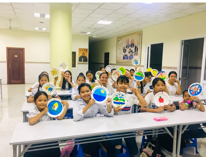
▲ 柬埔寨啟化道院中文班，除了中文基礎教學外，也十分重視學生的品格教育。