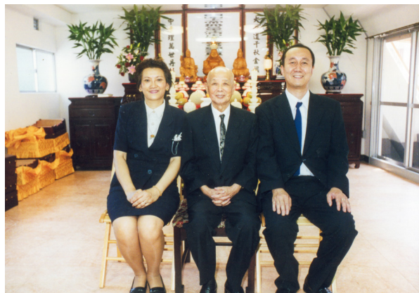
▲ 西元 2000 年 7 月 16 日，日本東京忠恕道院開壇，老前人與洪谷點傳師賢伉儷合照。

啟示我們，曾子在蒙師（孔子）指點後，回覆同學們的問題時所說的：「夫子之道，忠恕而已矣。」《論語·里仁》外，隱含著的意義，後學個人淺見是：「『夫』，起始語；『子』，得道的白陽弟子；『之道』，真我的路；『忠恕』，盡己之心，推己及人；『而已』，當前做主，當下承擔！」