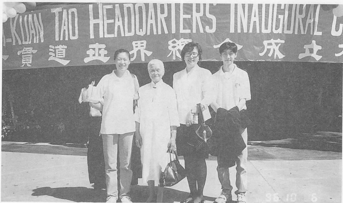
△孩子出國前，奶奶（左二）曾要求孩子每週必須回到道場參加開班。

又形成不知如何是好的困擾。一般在台灣社會環境下常誤導小孩，在異性之間很難能有純粹之友誼，因此規定不能隨便和異性跳舞，而在美國的高中往往在每一一年期中，學校都會舉辦五、六場的大型舞會，而男女同學都可以結伴參加，但那並不一定就是男女朋友，而只是普通朋友，在這樣的教育下，小孩可以看看所謂的大場面，因為所有的舞會都要穿西裝和禮服，而且孩子也不會驚扭，當他們與異性共舞或交談當中，自然而然也知道要如何去應對、交往和保護自己。