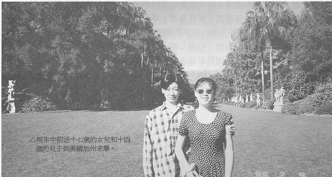
△兩年前送十七歲的女兒和十四歲的兒子到美國加州求學。

場合扮演著不同的角色和擔負著不同的問題，而所有的問題往往都是學校教育、倫理道德、行為品行、待人處事和親子之間的溝通，而這些問題也隨著社會文化、國家背景的不同而跟著改變，在這三年之中我和孩子們共同的面對了許多的問題，也做了許多的心理建設