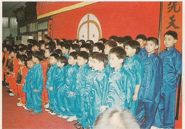
△朗朗兒童讀經—三字經與心經。