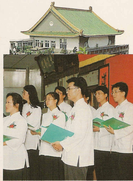
△合唱曲，唱出感恩的心。