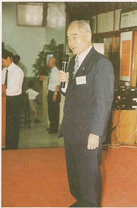
△連棟樑前人表達對各方的感謝之意。