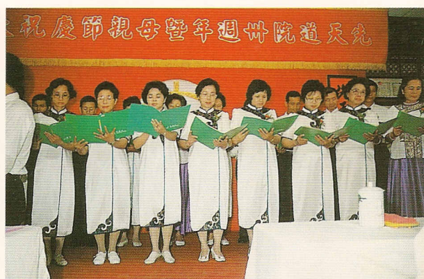
△先天道院雙溪區吟詩表演。