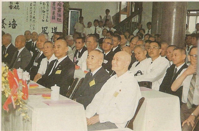
△各方致賀道親共一千五百多人。