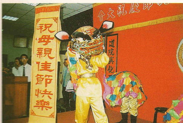
△先天道院慶三十，祝母親佳節快樂。