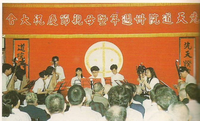
△天籟國樂團國樂演奏，讚頌母親真偉大。