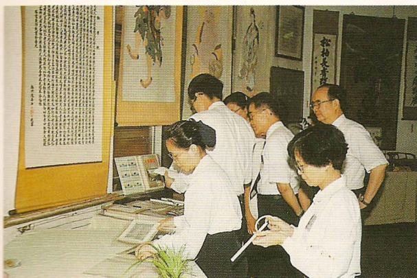
△文物展內容豐富，卅年的歷史軌跡歷歷在目。