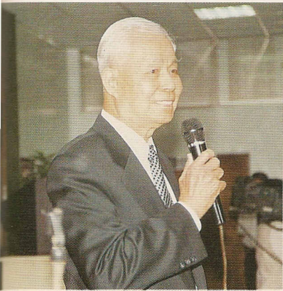
△張傳前人：時光飛逝，一轉眼就是三十年難得機緣，今天大家能共聚一堂。