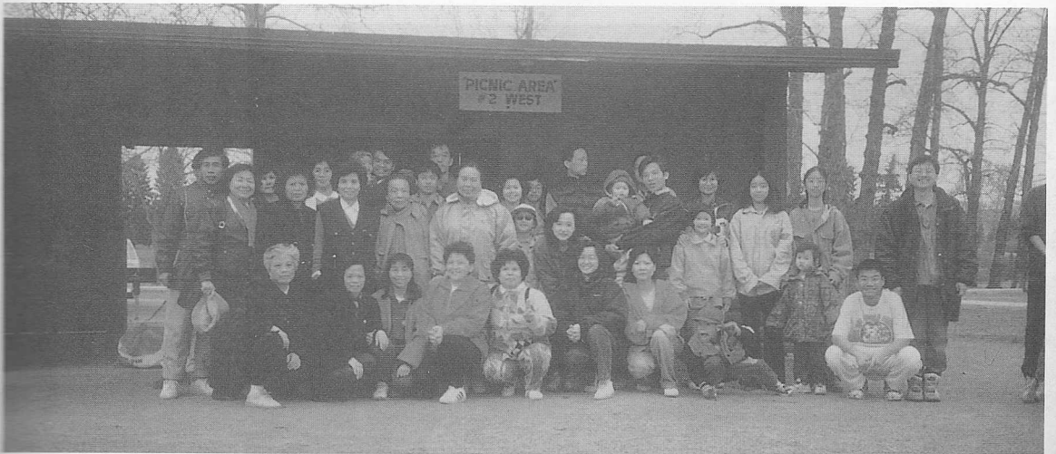
△卡加利的戶外活動，是心靈之會。