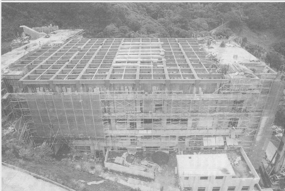
△結構紮實，百年之計。

忠恕道院頂層鋼架工程，堪稱宏偉壯觀，自從六月八日上樑典禮之後，七根巨型大鋼樑，一根根順利在八樓頂層安置妥當，作等距離排列，又配合大吊車的運作，一批專業工作人員，熟練而快速地在鋼樑間鎖釘巨型工字鐵，規格作業而縱橫有序，更在各工字鐵的銜接處，及工字鐵和大鋼樑接合處都焊接三角固定鋼板，於是整座頂層鋼架結構，固若金湯，形容其宏偉壯觀，實不為過。