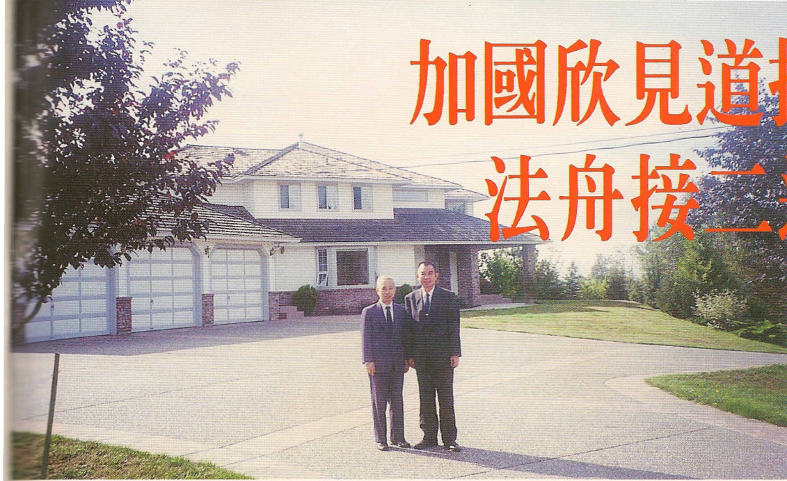
△天宇中堂建在六千坪的丘陵上，風景優美，彷彿仙境。