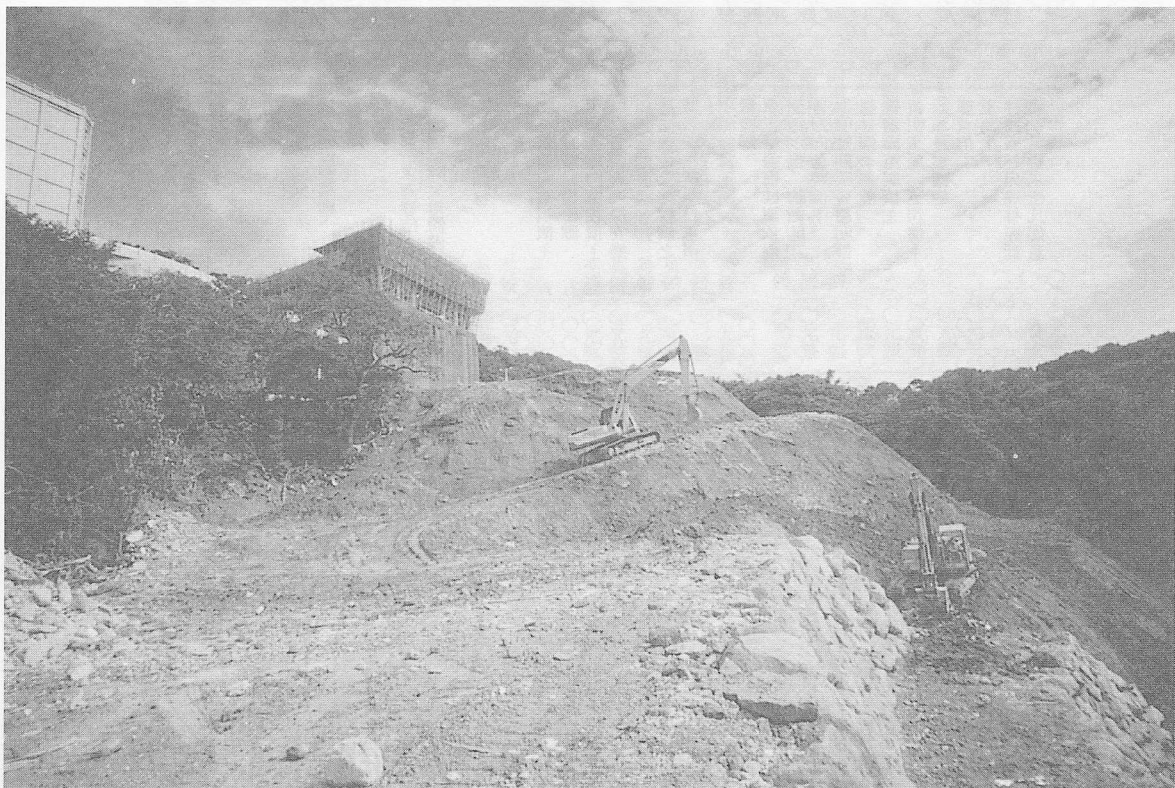
△停車場邊，坡坎石牆整建。