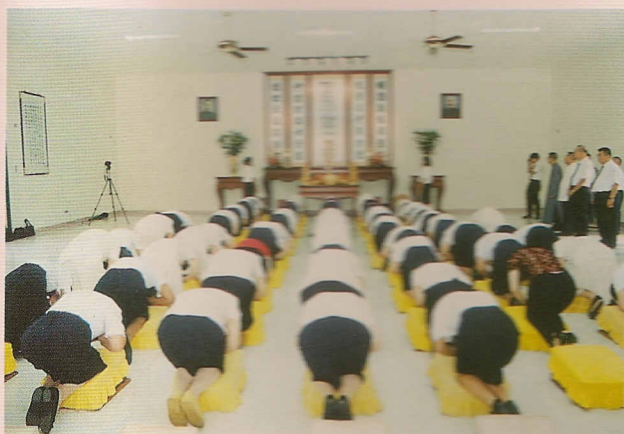
△莊嚴中堂中，行禮如儀。

落成典禮在老前人的慈悲賜導鼓勵及描戈律市長的肯定中，圓滿完成，參與此次盛會的道親，個個法喜充滿，以明亮的心迎向光明的前程。