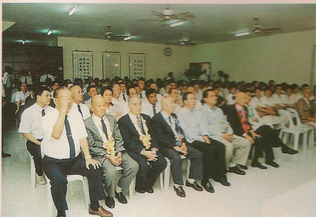
△賓客雲集，天人同讚。