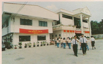
△描戈律忠恕道院外貌一景。