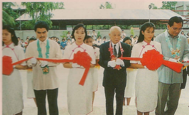
△老前人與描戈律市長（左二）、副市長（右一），於落成典禮中主持剪綵。