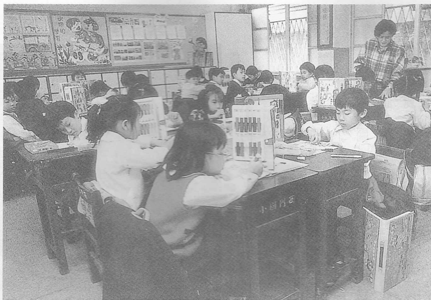
△教師雖然學有專精，卻不專精所有的事，美術老師也各有其專精心得。