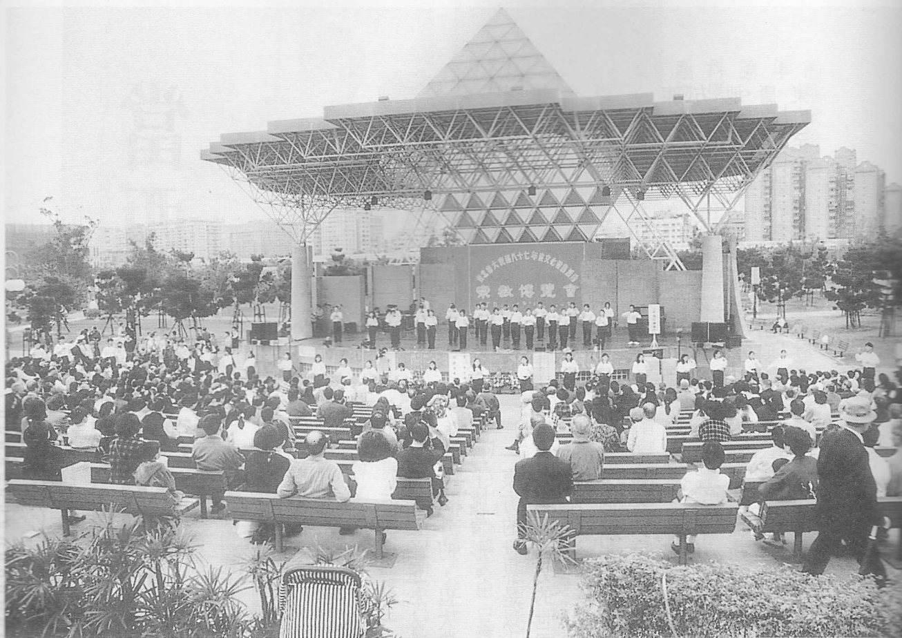
△公園也提供了最佳的休閒場地。

才能豐富他的生活，長大之後，怎會除了KTV、夜總會就不知道該如何安排自己的時間呢？