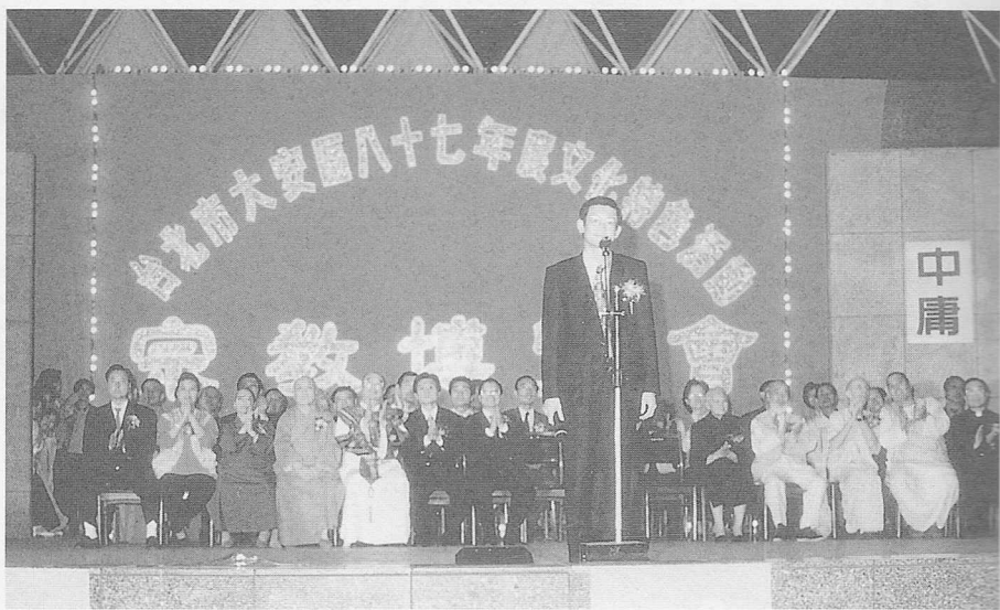
△台北市林嘉誠副市長，主持點燈儀式。