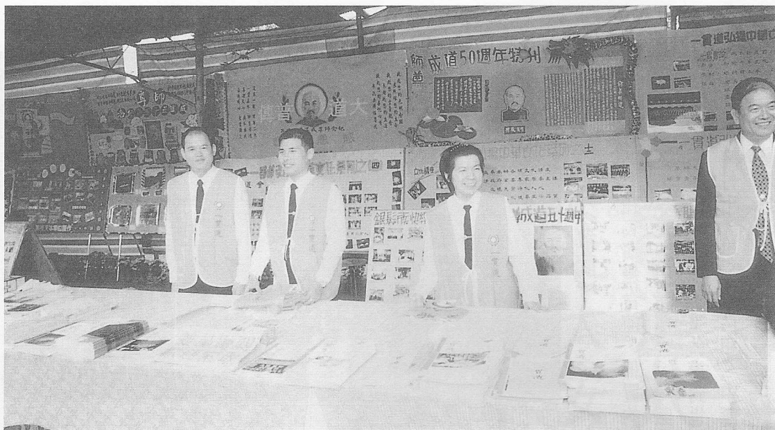
△一貫道所參展之海報、圖文、看板，琳瑯滿目。

，及禮拜、佛壇、法器展出，也有眾神尊列、敲打彈誦、吟唱奏樂、及神力加持、靜座默禱等；每個攤位佈置，或光鮮亮麗、或樸素莊嚴，均突顯出不同的特色。