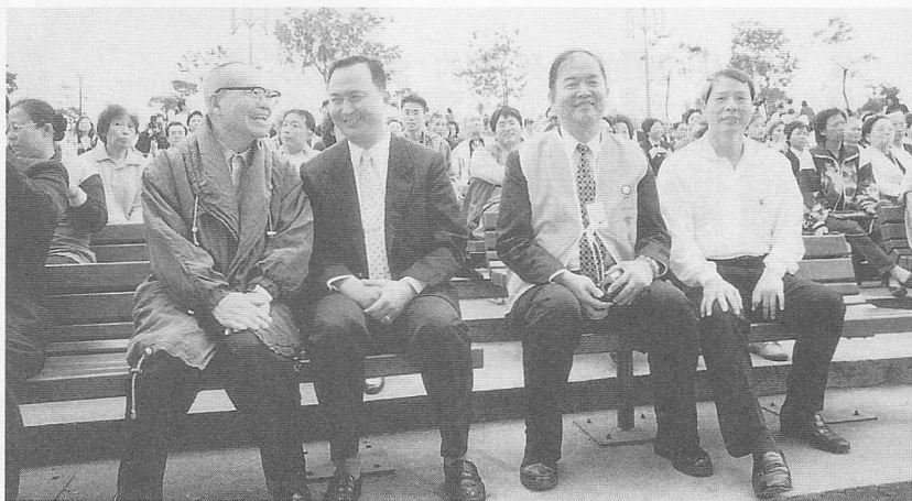
△一貫道北市分會簡理事長（右三），參與盛會。

、宣講教義、影片欣賞等不一而足。內容相當精彩，以各種不同的方式表達他們對上帝、天主或宇宙主宰的崇敬與感恩，也藉此傳揚真理福音，廣化群生。