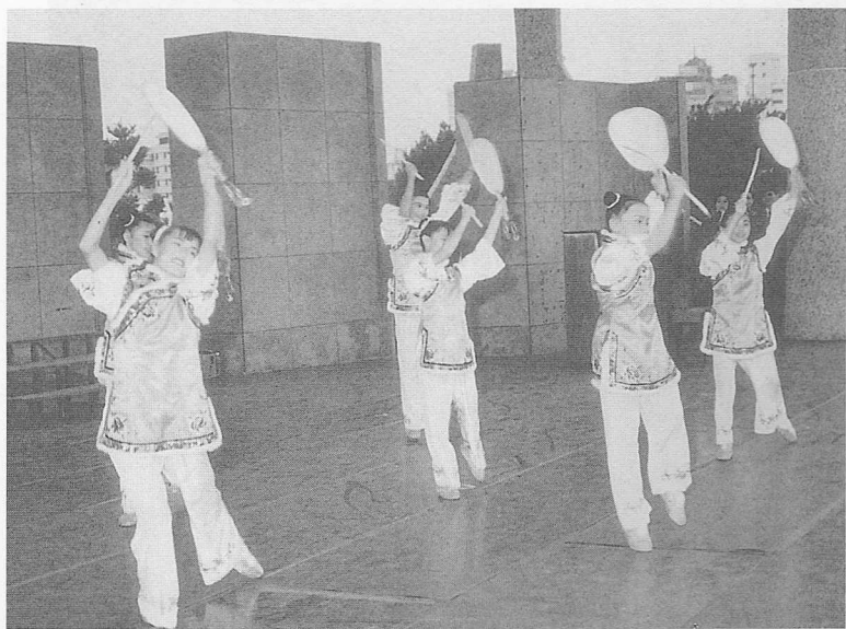
△安東道場的「小天使舞蹈」，博得熱烈掌聲。

理一探道奧，又能學習烹飪，獨立自足，將來進入社會上能成爲社會上的一股清流，做個新好男人、新好女人。一曲馬來西亞歌——「童年頌」飛揚快樂的旋律配合全場的掌聲立即感染在場每一個人的心，台上帶動、台下唱和，青春的歌聲讓大家都憶起美好純真的童年，博得全場熱烈的掌聲。第二