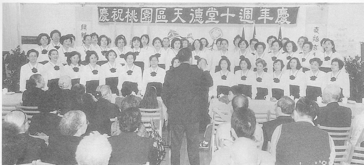
△桃園區長青合唱團精彩演出。

又另設帳蓬，備有麻薯餐食，讓來參加慶典的二千多位國內外道親們共同分享。十一時卅分，恭迎老前人、簡前人暨各位點傳師蒞臨園遊會場，揭開了序幕，園遊會所擺攤位有來自台北、花東、桃園、大園、中壢、觀音、平鎮、八德、楊梅、湖口、龍潭等地區共十二