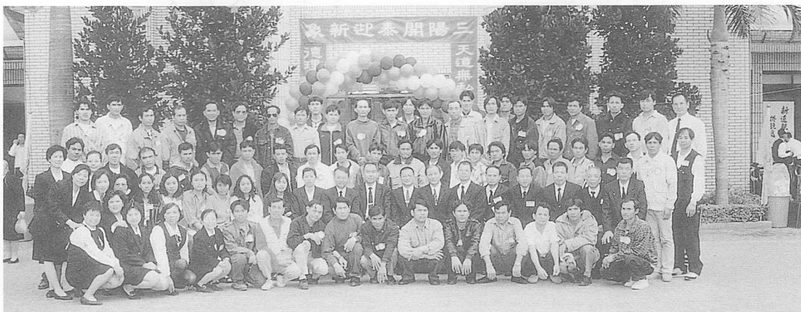
△泰國道親參加一天法會後合影。