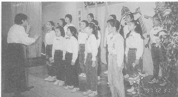
△桃園區少年合唱團，歌聲美妙。

又另設帳蓬，備有麻薯餐食，讓來參加慶典的二千多位國內外道親們共同分享。十一時卅分，恭迎老前人、簡前人暨各位點傳師蒞臨園遊會場，揭開了序幕，園遊會所擺攤位有來自台北、花東、桃園、大園、中壢、觀音、平鎮、八德、楊梅、湖口、龍潭等地區共十二