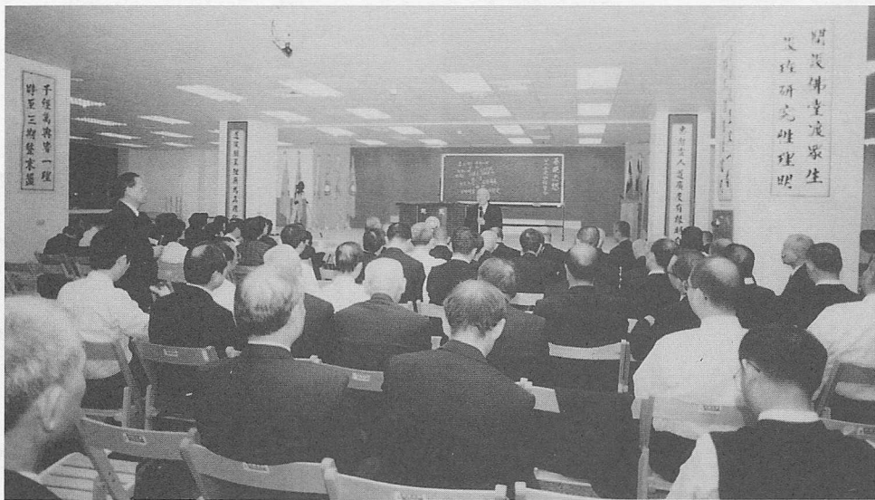
△分組檢討：主班點傳師組。