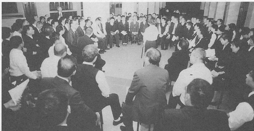
△班長組熱絡討論之情形。

家要有「只問耕耘，不問收穫」的精神，盡心盡力的向上天表白，以盡各自的責任，希望基礎忠恕道場的道務，能一天比一天更好。