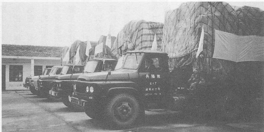
△5,500條愛心棉被，裝成八大卡車，等待捐贈儀式完畢，即刻出發。