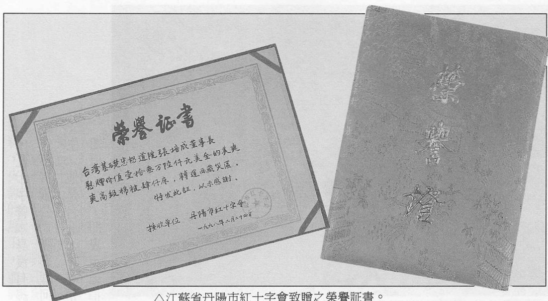
△江蘇省丹陽市紅十字會致贈之榮譽證書。