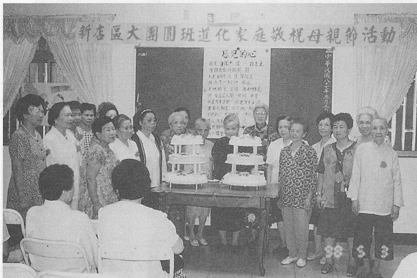
△恭賀表揚廿位道化家庭的慈母。