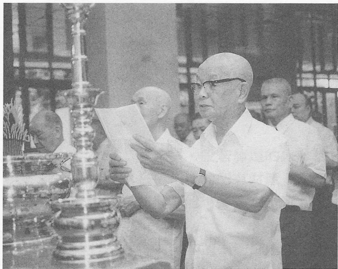
△老前人恭讀疏文，懇求國泰民安。

老前人有感於台灣地區今年大小災難頻傳：如二月十六日於桃園大園鄉，發生震驚海內外的華航班機空難，罹難人數高達兩百零二人；緊接著又有國華班機失事；加上火災、水患、車禍、腸病毒等多起事件，導致社會人心惶恐不安，為使這些天災人禍減至最低限度，並為社會盡一份心力，老前人於是發動基礎忠恕所有點傳師，舉辦向上天懇求國泰民安祈禱會。