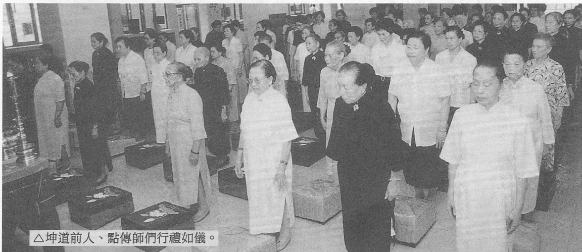
△坤道前人、點傳師們行禮如儀。

老前人有感於台灣地區今年大小災難頻傳：如二月十六日於桃園大園鄉，發生震驚海內外的華航班機空難，罹難人數高達兩百零二人；緊接著又有國華班機失事；加上火災、水患、車禍、腸病毒等多起事件，導致社會人心惶恐不安，為使這些天災人禍減至最低限度，並為社會盡一份心力，老前人於是發動基礎忠恕所有點傳師，舉辦向上天懇求國泰民安祈禱會。