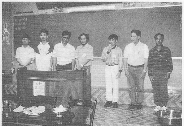
△即將返回泰國的道親，發表離別感言。

เวที ถ่ายทอด ความรู้สึก จากใจ และ ความ ประ- ทับใจ ที่ ได้รับ กราบระลึก ถึง พระมหากษัตริย์ ของ สหราชอาณาจักร เบื้องบน สำนึกใจว่า ศรัทธา - กลับบ้าน จะ นำ ธรรม อันล้ำค่านี้ ไป บอกรับ ดู ช่วย ประชาชน ชาวไทย เริ่ม จาก คนใน ครอบครัว , ญาติสนิท มิตรสหาย เมื่อ ชักชวน กัน ได้ ครบถ้วน แล้ว ก็ จะ จดหมาย มา ช่าง ไต้หวัน - ทราบ และ เมื่อ ถึง เวลา นั้น เราทุกคน ก็ ได้ ได้ พบกัน ที่ เมือง ไทย ( หัวนี้ หมายถึง ท่าน - อาจารย์ และ ญาติธรรม รุ่นพี่ ทั้งหลาย ด้วย )