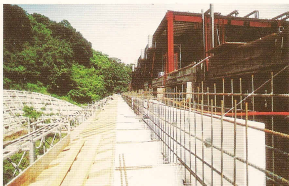
△蓮座斗拱模後面之水泥樑工程。