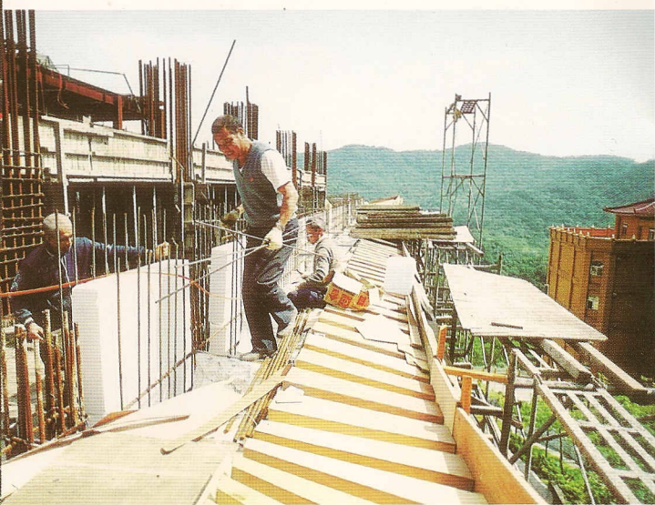
△義工們的協助,更增添了一股無比的力量。