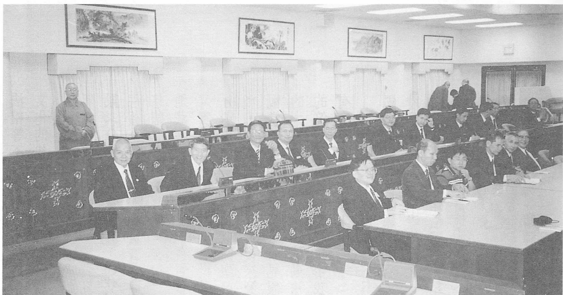
△於西來寺會議廳，由法師作沿革簡介。