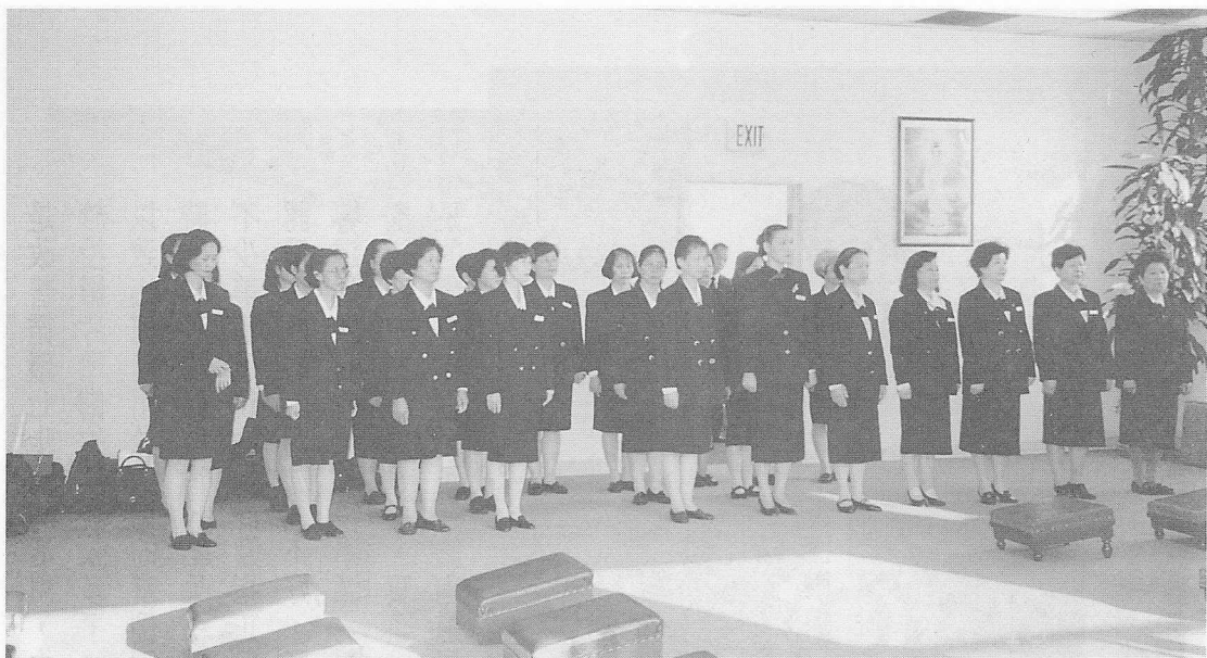
△出國這些日子，彼此更互相了解，法會中也展現了「禮」的精神。

到了，雖然相處才一天，但濃烈的道親情，讓我們湧現了依依離情，在美國道親列隊揮手相送下，我們的遊覽車緩緩地駛離全真道院，望著熱情洋溢的美國道親及莊嚴樸實的全真道院，我們不禁在心中吶喊：「再見了！全真道院及道親們！希望能有下次再來的機會。」就這樣，讓我們終身難忘的法會就在美麗的晚霞光輝中圓滿的落幕了。