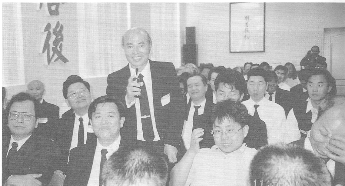
△在美國的道親，於法會中發言踴躍。

修道離不開生活，如果不能把真理落實於生活中，則累世的積習及氣稟，滋蔓難除，修得再久，心性還是不能提昇。最後由後學代表法施學系報告「從道學粹語談一貫道的修持理念」並由黃明雲學長主持研討的時段，經過前面二個單元的熱身，這時美國道親發言的次數也漸增多了，幾位博士級的道親，談到生活在美國，各方面所受到的壓力，比起國內是大的很多，沒有身歷其境是無法體會這種感受的，在這種環境中，他們每週仍能開著一個小時以上的車程來全真道院參班，實在是受到兩位點傳師苦心成全的精神感召，也敬佩點傳師那種愷悌君子的修道風範，由他們的報告中，我們更深刻地體悟：要把道務推展開來，用心的成全是非常重要的而且必須的。今天，全真道院能有