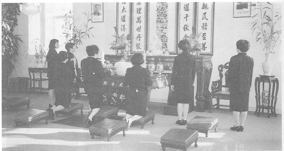
△出國前即動練禮節，以應執禮之任務。

及對老中的信心，韋路藍縷於這人生地不熟的地方展開道務，經過幾年來披星戴月的艱苦奮鬥，終於為上天在美國這片汪洋中，建立了一艘普渡眾生的法船，兩位點傳師這種不畏艱難、勇往直前的辦道精神，正是我們最好的榜樣，雖然過去是十年寒窗無人知，但如今已是一舉成名天下聞，兩位點傳師的行誼，我們已深感受教了一堂寶貴的課程，而法會也正式地展開了。