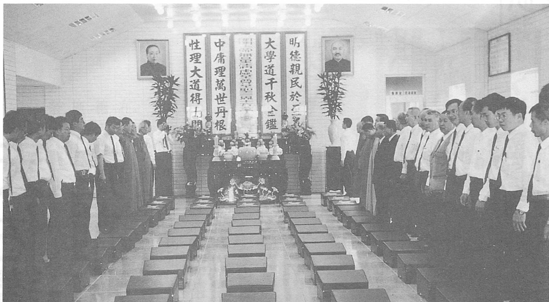
△莊嚴隆重的開壇典禮。

辦道，護壇人員、引保師、執禮人員、新求道人留在中堂，其餘道親則到二樓講堂聆聽老人慈悲賜導。