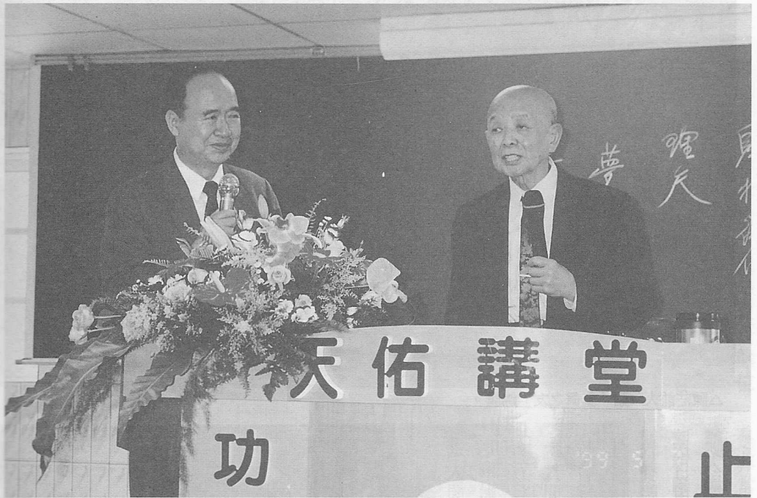
△老前人主持開壇後慈悲賜導。