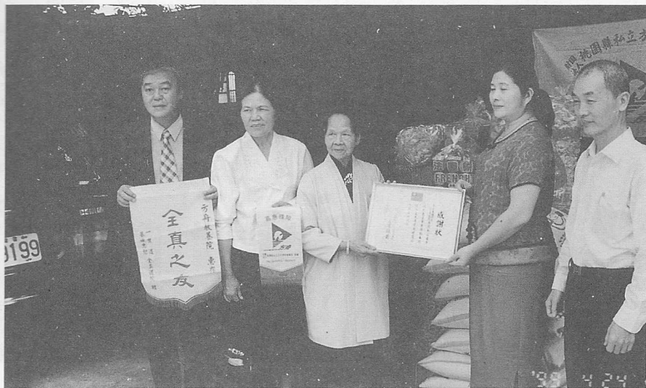
△陳茫前人代表接受「感謝狀」。

令人心曠神怡。院中有百餘位院民，有近一半是遊民，三十多位殘障者，其餘都是智障者。院中只有十四位老師，可說