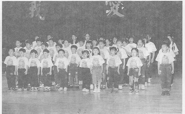
△清純可愛的彌勒兒童班讀經表演。