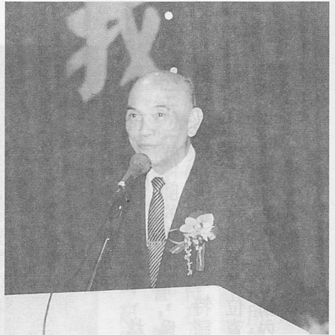
△大會主席簡前人致詞之神情。