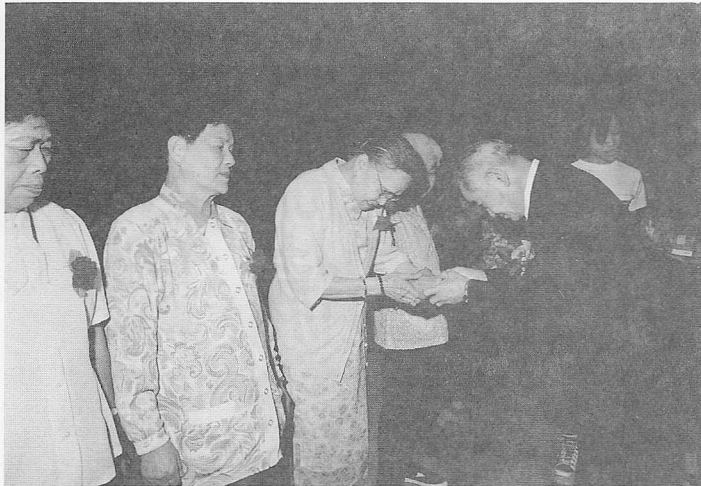
△連前人致贈母親節感恩禮物予母親代表。