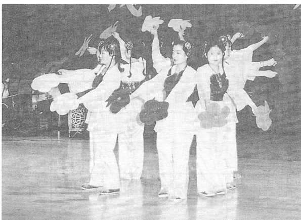
△天籟服務團表演舞蹈，宛如仙女下凡。

為捕捉慈母的身影及對母 親表達感恩之情，大會還舉辦 了攝影和創作文摘比賽。另有 多項精彩節目表演，像舞蹈、 兒童讀經及民生社區的太極拳 表演等。除了節目表演外，由 青年組所帶來的「奶奶的健康 操」，更將台上台下融為一體 ，最後在大家合唱「我的老 中娘」歌聲中，互道珍重再見。