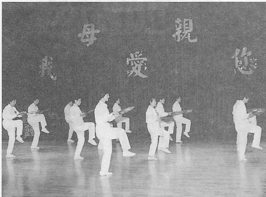
△民生社區太極拳隊表演太極扇，動作整齊劃一。