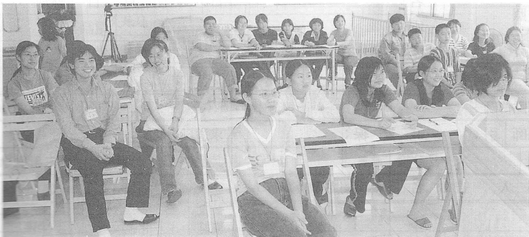
△幹訓班課程安排，頗具吸引力。

出，每位學長都能發揮所能，盡力參與。 本次的活動，期待在八月中旬能帶領兒童夏令營，讓更多道親之欣欣學子能一起成長