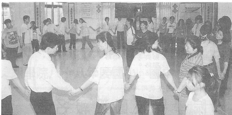
△團體遊戲，大家一起來。