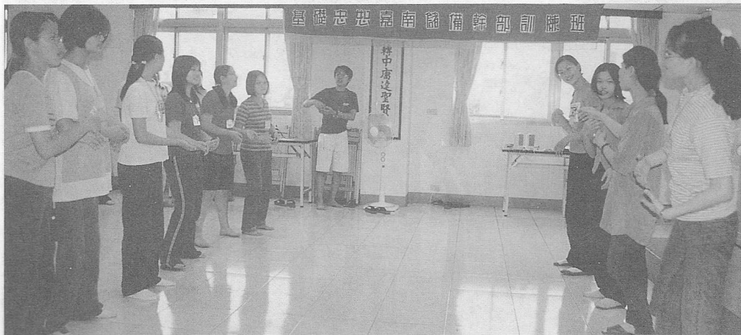
△各式團康活動，帶動方式之演練。

分靜、動兩種。靜態有：(1)夏令營組織架構及各組工作職責(2)靜態遊戲課程介紹(3)服務人員應有的態度(4)何謂輔導學長(5)晚會設計(6)營前之心理建設(7)雙向溝通與座談會。動態有：介紹各式團康、帶動方式、運用時機、舉一反三、團體遊戲介紹、即席演講、美妙旋律等等。在活動的進行中，從各位學長們熱烈的參與，快樂的笑容及充滿希望的神情裡能看