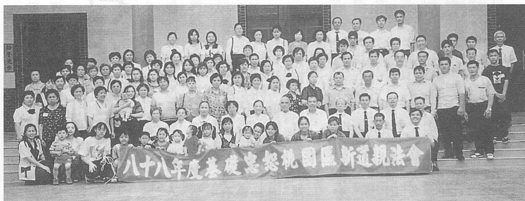
△參加法會道親全體於中一堂前合影。

最後心靈迴響，大家踴躍發言，並相繼領取新民班報名表，個個在法喜充滿中，發出至誠之心而圓滿結束此次的法會。