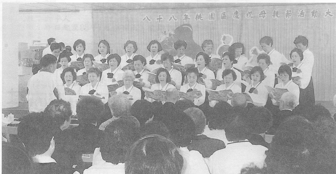
△桃園區長青合唱團之道歌，感人肺腑。