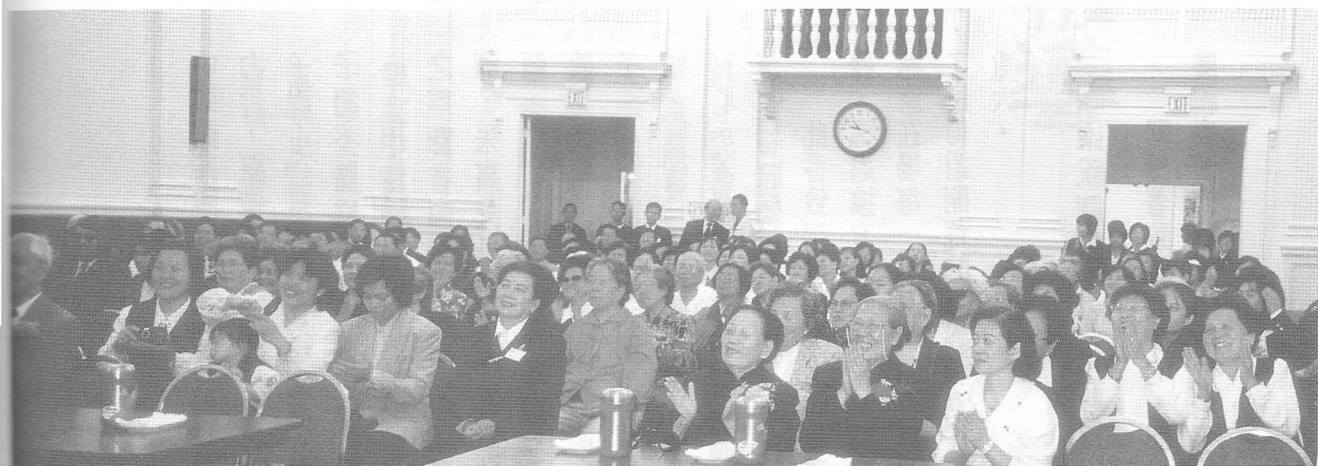
△週年慶表演節目精彩，道親們笑口常開。

龐雜的劇碼終有落幕的一刻，在這天人同歡的當兒，尾聲當然是以改寫為喜劇收場，圓滿和樂，君不見蝴蝶翩翩飛舞，悵然神去，只見滿場歡喜，把慶祝活動的氣氛拉上最高潮，意猶未盡，這不正是文化薪傳，古風再現的絕佳證明