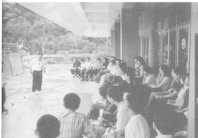
△非常乾坤，道中喜相逢。