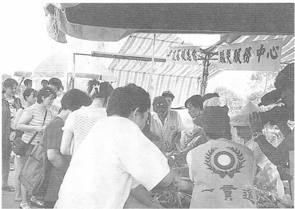
△環球電視台採訪東勢河濱公園賑災站。