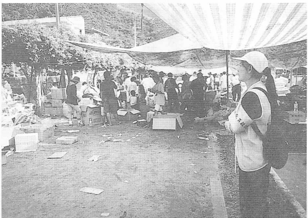
△光輝道院與「文化社區環境組織」合作，深入角落關懷。