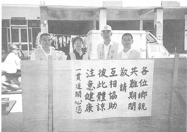
△指揮中心點傳師關懷各賑災站情形。