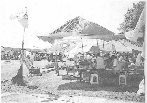
△埔里宏仁國中賑災站，每餐服務 1600 人。