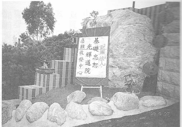
△中部指揮調度中心在光輝道院設立。