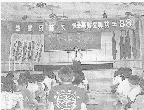
△文藝研習營，始業式開鑼了！