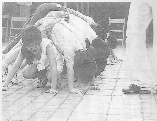
△趣味競賽—不亦樂乎。