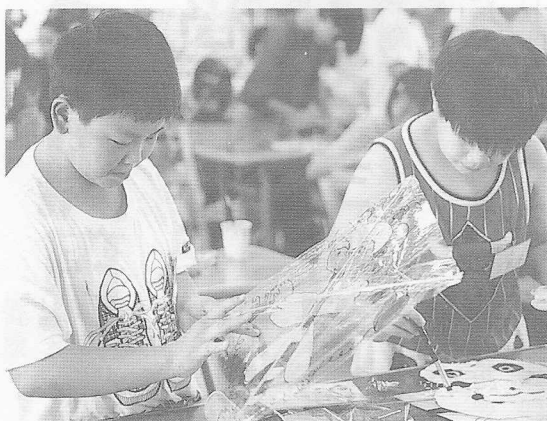
△小朋友們彩繪風箏，欲罷不能。