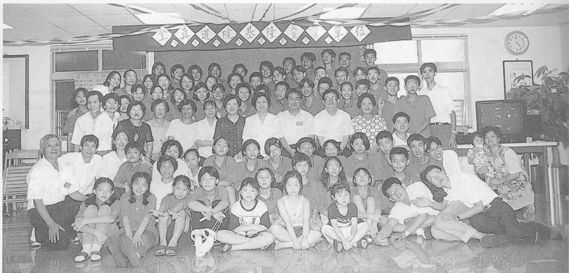
△全體攝於天龍講堂。