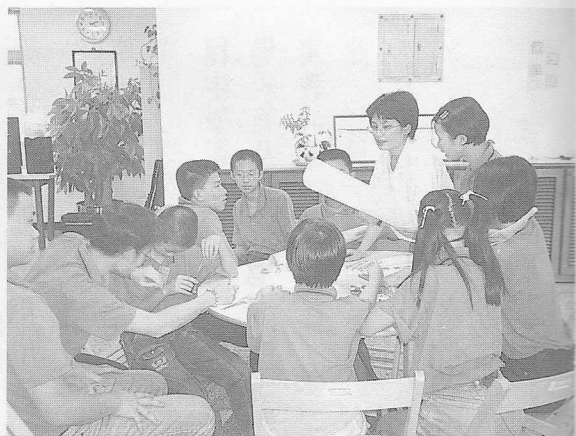
△小組合作，動動腦筋。

會，能暫時拋開世俗的一切，而置身在此世外桃源，輔導學長們的付出及許許多多的廚房媽媽的拿手絕活，讓我們在這二天裡，吃得好、睡得飽，還有莊嚴的中堂（慈毅講堂）讓我們流連忘返！ 本次參加的學員有近七十七位，加上幹部近百位。是什麼樣的因緣，讓我們大家此時相聚在一起，是殊勝的道吧？我們相信道中的小道苗就是要細心地加以呵護與灌溉，使未來道中的棟樑，不被外面形形色色所誘惑，讓寧靜純潔的心靈永遠留在我們每一個人的心中。感謝天恩師德、老前人、前人及點傳師的慈悲，以及許許多多付出的學長們，讓本次的活動圓滿順利，期待下次的再相見。