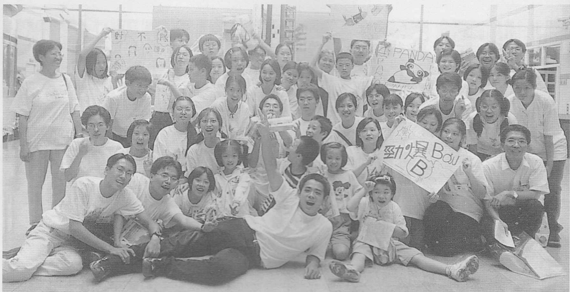
△天文科學館之旅，學員無不充實、喜悅。