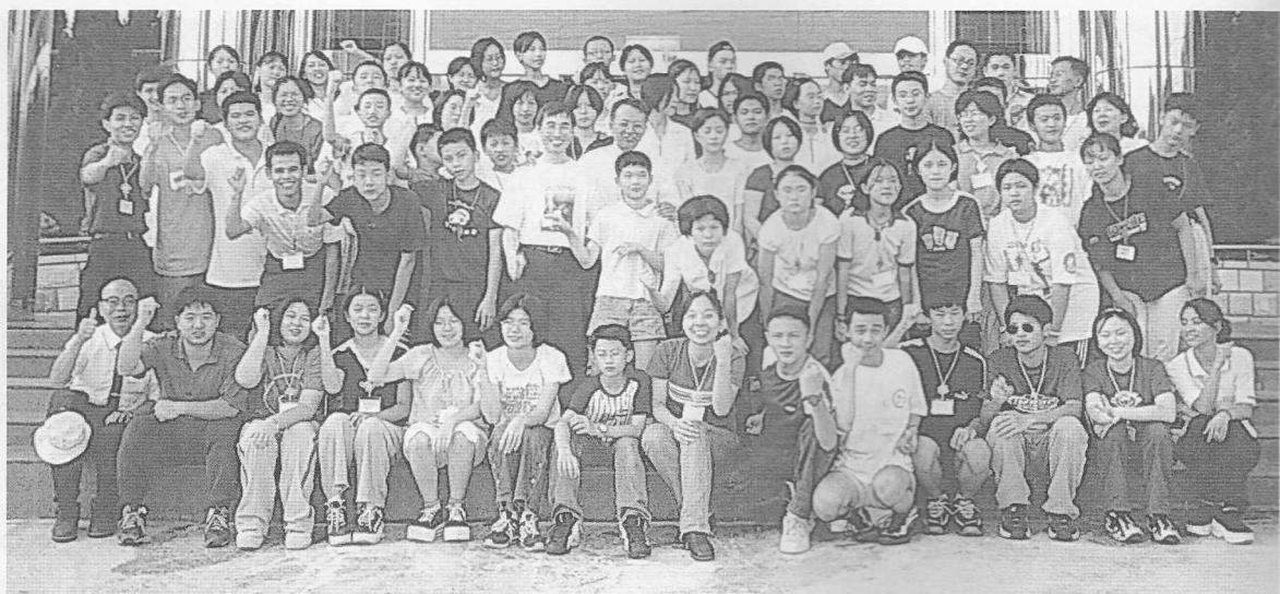
△參訪忠恕道院，於大門前合影。