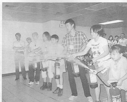
△參訪防災科教館，滅火器操作實況。

本次活動地點置於中一堂，目的在使青少年道親瞭解「忠恕道院」建設淵源，親睹老中堂一樑一柱均是前賢秉持修道堅毅精神，努力不懈，從無到有的愿力共成，以及辛勤工程建設成果，承蒙王垂禾點傳師撥冗講解，使我們得以見識總壇建設的宏偉，亦使我們體認到老中堂的意義，所有學員均期盼這無上的大法船，早日完工，渡化眾生。 活動的尾聲在六福村野生動物園中，在活動組的帶動下，歌聲、笑聲洋溢著學員的臉上，感謝天恩師德！讓我們有這個機緣共同學習體驗生命、慧命的自覺，所有參予活動的學員們也願開展生命的光和熱——愛人、助人、快樂、成長，相信這也是回歸理天的一條道路。