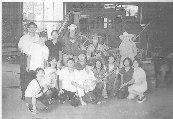
△參訪六福村美國館。

台北市立防災科教館仿倣日本東京災害防治科學教育中心以先進電子、電化資訊結合電機設備，模擬火災、地震、颱風等自然災害狀況，使學員學習災害應變措施、火場逃生、消防器材使用等自救救人的本領，這是生命教育的重大課題。