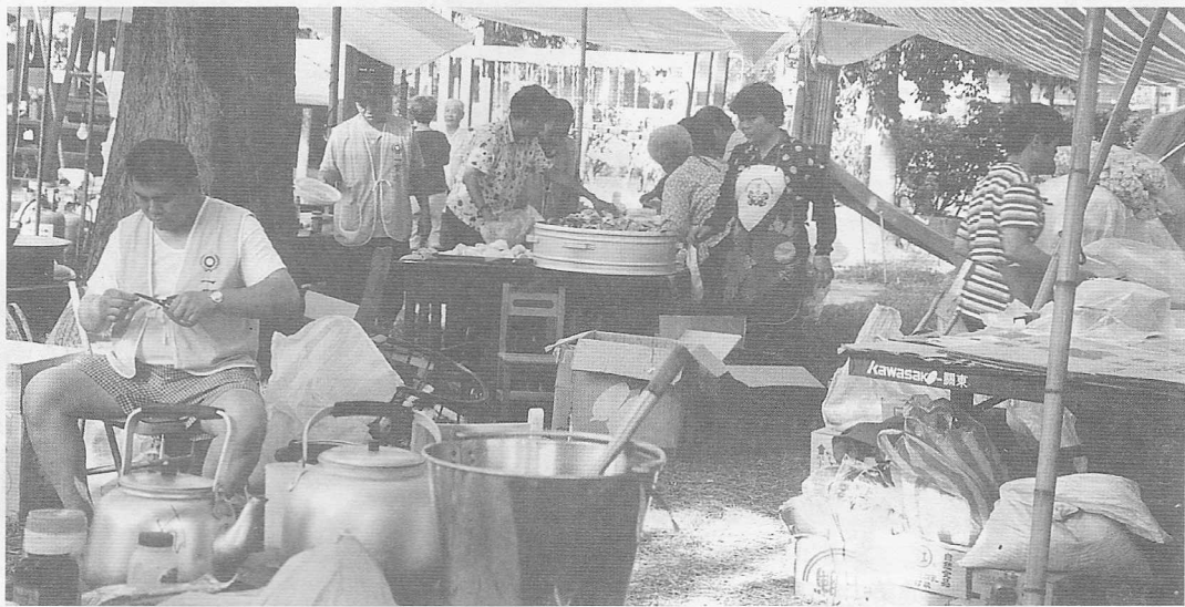
△廚師們不停地忙進忙出。

你的生活嗎？貳、您認為我們何時撤走較為妥適？分析結果發現：災民多認為我們撤走對於災民會有所影響，當問及希望我們何時撤走時，有百分之六十二認為六日以內撤走無妨！有鑒於竹山之商業活動已逐漸恢復中，在經過道務中心的同意之下，遂作成於十月十日撤離之決議，並於三天前在救災中心附近張貼公告，對於用餐方面仍有困難者，提出兩項作法：1. 安排至就近之素食館用餐 2. 提供經濟上之支援。