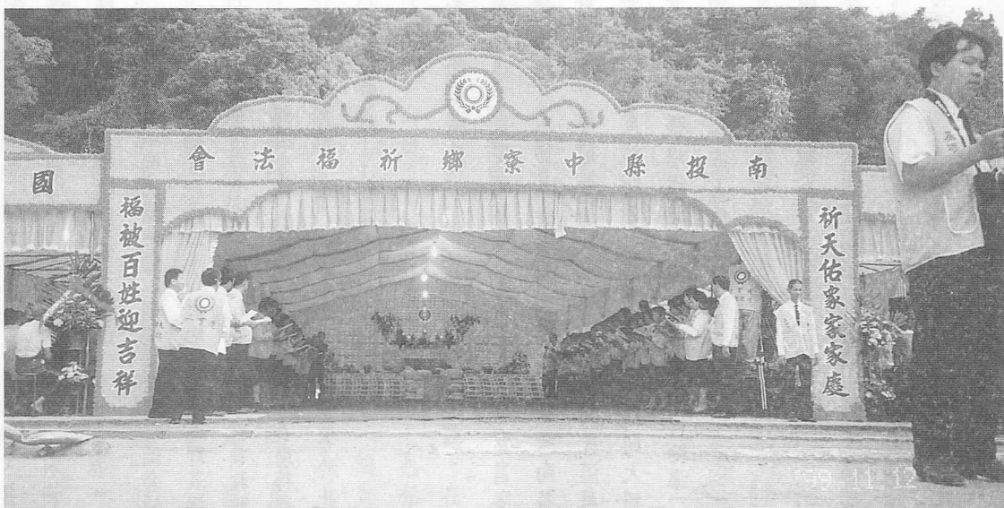
△莊嚴肅穆的祈福法會會場。