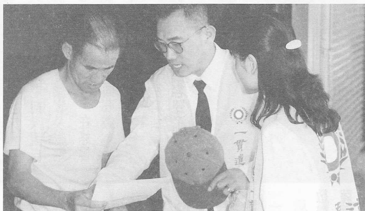
△掃街人員拜訪鄉民。

十一月十一日各組的工作人員大部份已進駐中寮鄉，此時場地也已佈置完成，當晚總幹事召開第三次