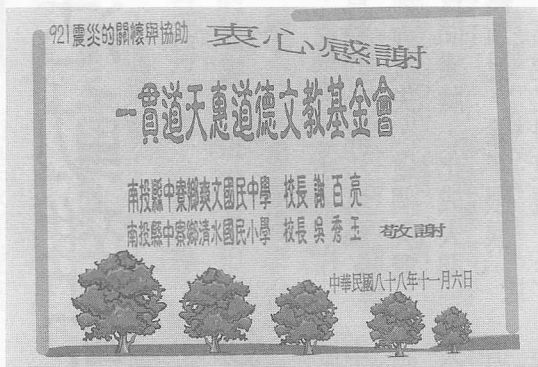
◁ 中寮鄉爽文國中及清水國小的感謝海報。

這次賑災能讓災民肯定讚揚，要感謝天恩師德，老前人、前人、老點傳師慈悲，才能使賑災工作順利、平安、圓滿。謝謝！