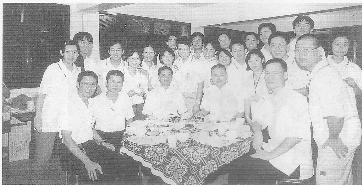
△點傳師與學員們的溫馨饗宴。