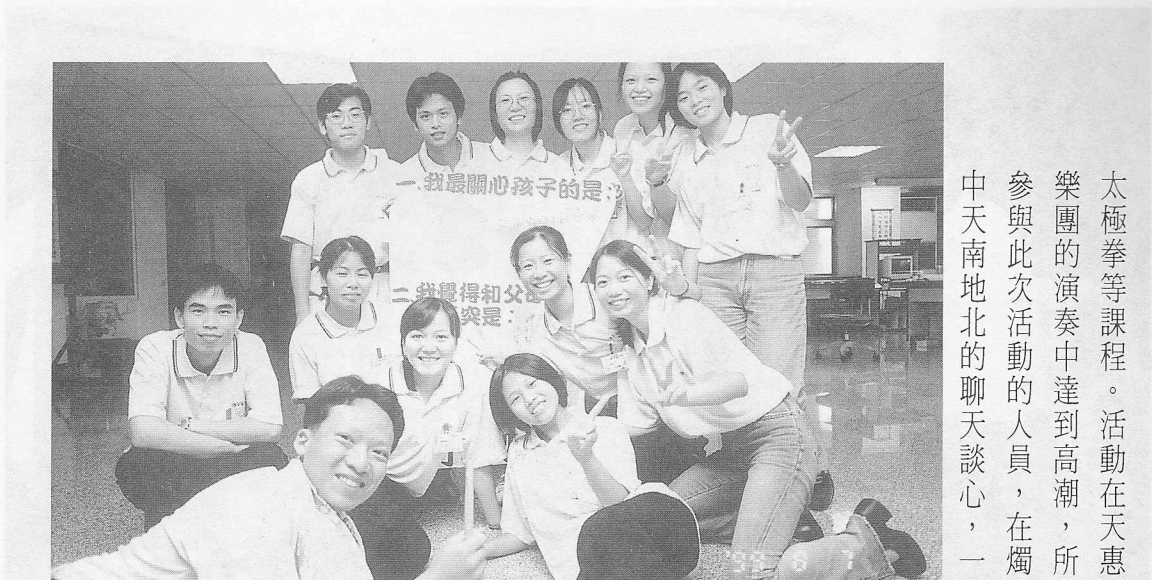
△有疑必問，將心中的疑問提出來請益。

太極拳等課程。活動在天惠國樂團的演奏中達到高潮，所有參與此次活動的人員，在燭光中天南地北的聊天談心，一邊