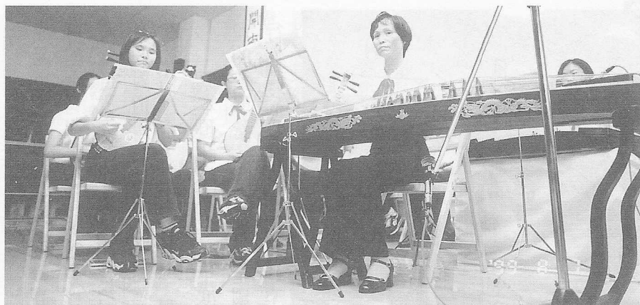
△天惠國樂團的熱情演出。

太極拳等課程。活動在天惠國樂團的演奏中達到高潮，所有參與此次活動的人員，在燭光中天南地北的聊天談心，一邊