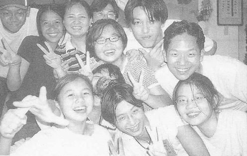
△青春歡笑—明日的希望。