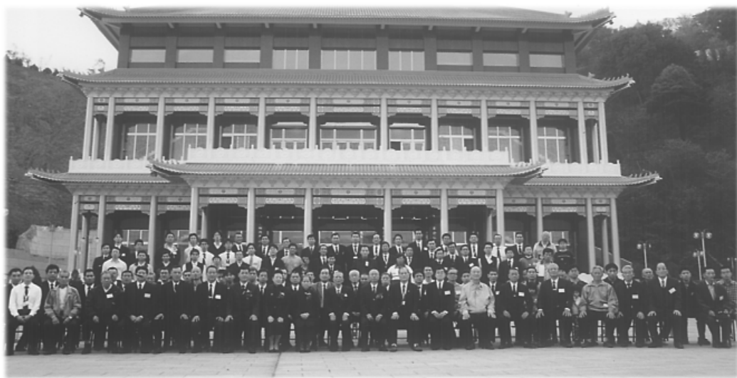
明明上帝主殿前合影。