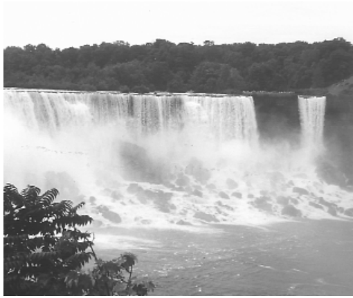
瀑布溪流，能製造負離子的新鮮空氣。