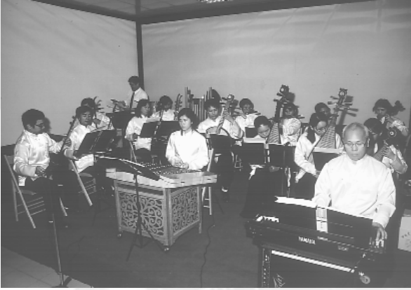
忠恕國樂團優雅的演奏聲，莊嚴了整個會場。