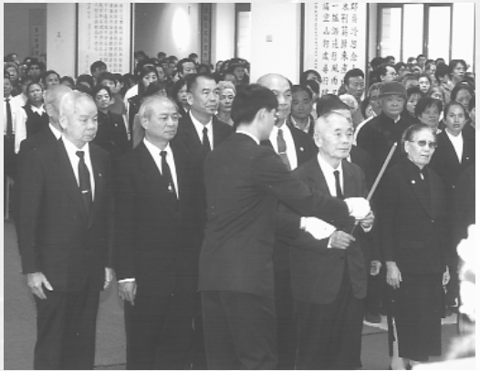
春季祭典由袁前人主祭。