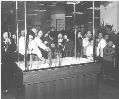
家屬們虔誠參與統一祭拜。