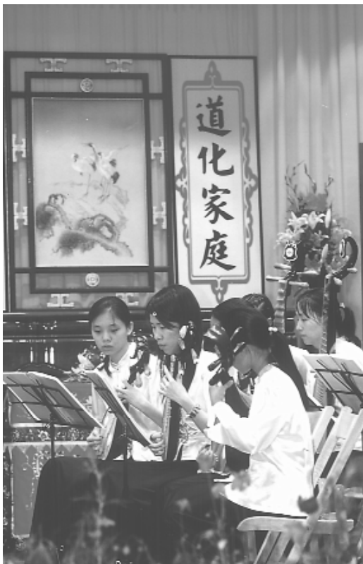
忠恕國樂團演奏迎賓曲。

早上十時許，全場用最感恩、最宏亮的聲音恭迎前人、貴賓進場，以最熱烈的掌聲歡迎袁前人，感恩他老人家專程來表揚大會鼓勵我們。會場中