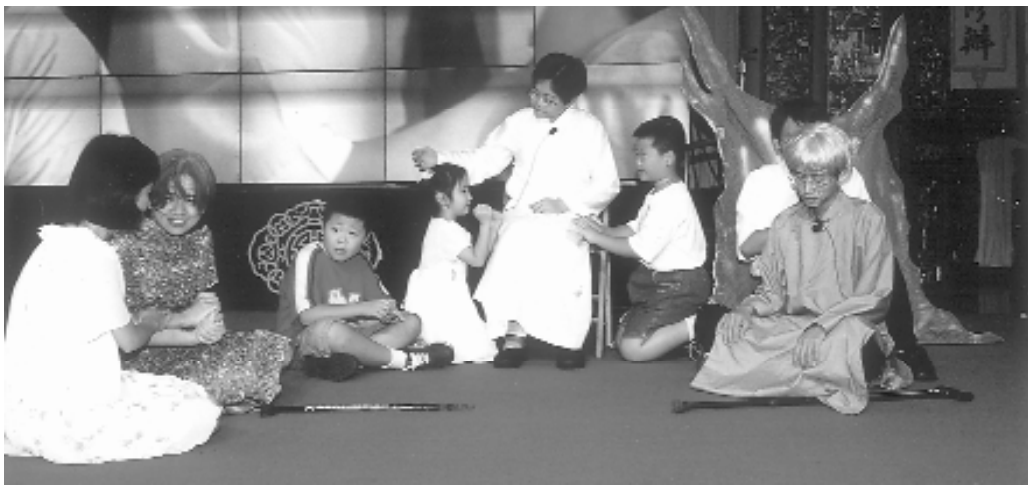
蘋果樹的啟示，讓人感念前人輩的用心。