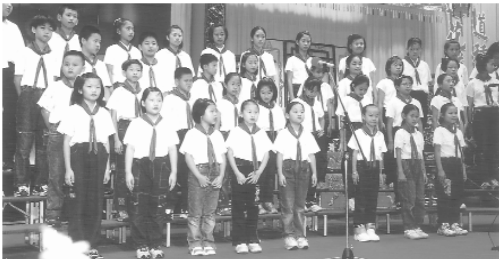
兒童合唱團演唱：「我們要這樣長大」。

庭代表起立，接受祝福與恭喜！多位認識的學長們在道場各個角落服務著，今天竟然都成了受獎家庭代表家屬，可見他們平日在道場的付出，也同時都能兼顧家庭三代修道，真是非常的了不起！