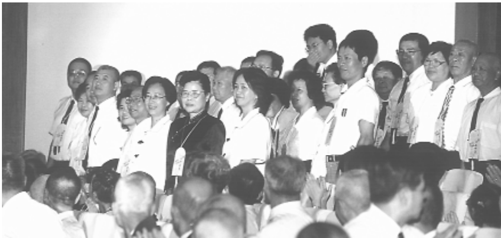
受獎家庭代表起立接受祝賀。

族，他們全家二十多人今日都來了！說的：「我們整個家族都有修道，大家都互相忍讓、不會計較，彼此互助、同心同德，相處得很好、很快樂！」這就是三代同堂最好的證明，確實值得鼓勵。