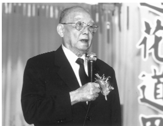
周前人鼓勵大家要感恩。

到砍掉樹幹的感人故事！由年輕學長娓娓闡述，我們在老中的慈憫和恩德庇蔭中成長，老中娘的苦口婆心、殷切期盼，唯有不斷進德修業精進，救度眾生出離苦海，以報天恩師德。在悠悠的樂聲中，讓大家有深刻的體會。感念前人輩的用心，在數十年的修辦道中，無盡的付出，後輩們要努力的空间也太多太多了！