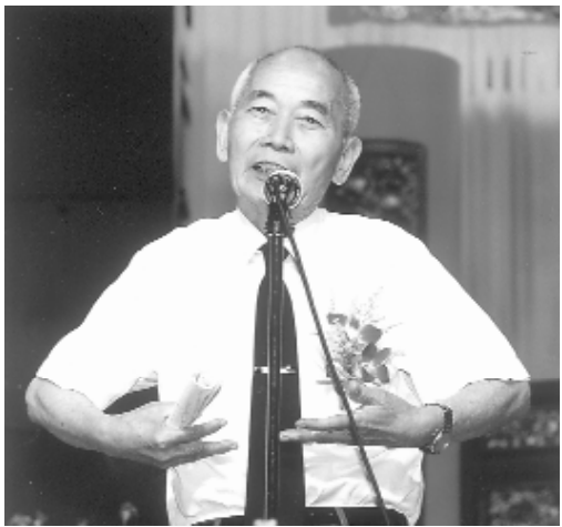
袁前人勉勵道親們齊家修道。

家庭是最溫暖的所在，一貫道傳承儒家思想，符合在家修持、能夠兼顧孝道的重要特色，所謂「人道盡、天道近」和三代同堂的好處，希望表揚大會的意義能延伸，家中親友尚未求道或小輩尚未進入道場者，都能鼓勵近道，才能得到道的庇佑。