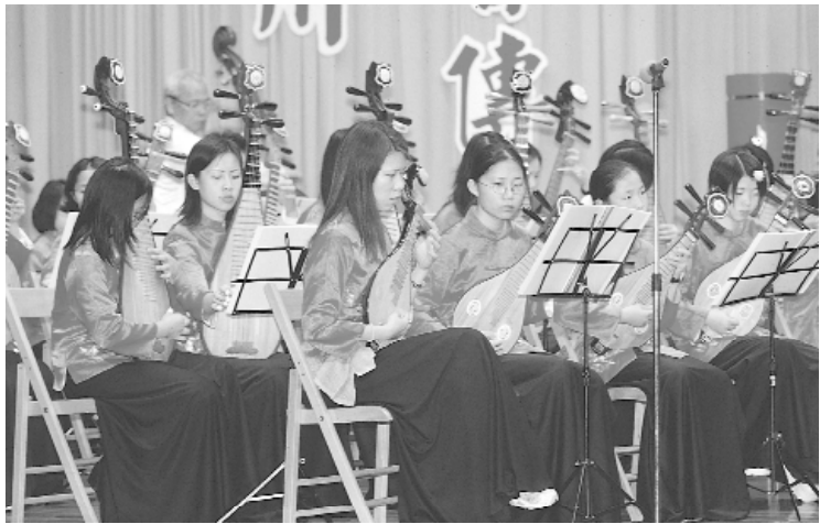
團員皆由精英所組成。