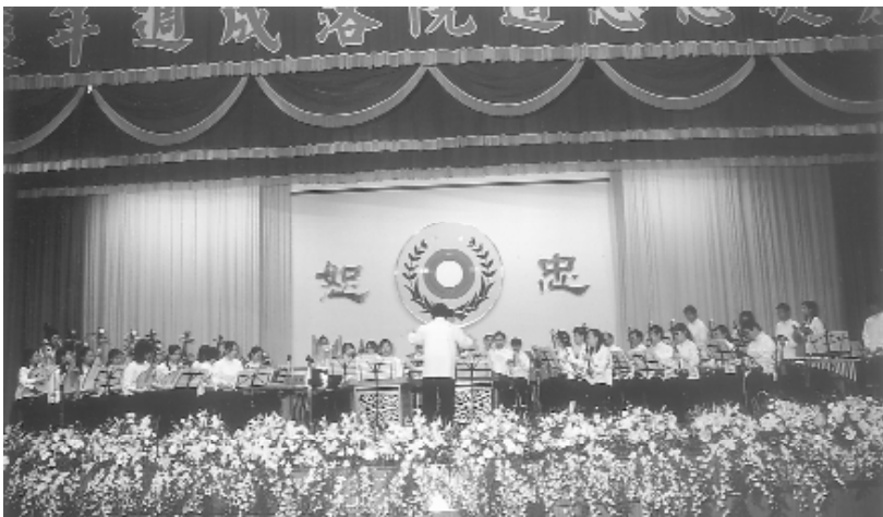
大型活動的演出，是演奏技巧提昇的展現。

再由冠伯學長拿回家用著非常非常麻煩的手續，將這天錄下的東西弄到網路上去給我們欣賞。於是，我就將我家的一數位錄音筆「給帶去使用，回到