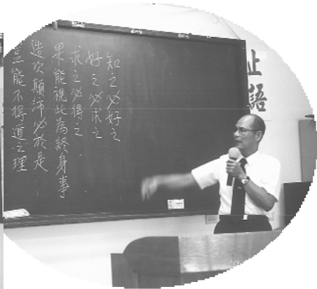
龍欽烈點傳師於法會中慈悲賜導。

已去渡化了很久，但，總是推辭說：「沒有時間。」那天的拜訪學長們都很用心，且誠懇的和他聊天，最後是以一張顯化的相片，讓他動了心，連同他的夫人一起求得了寶貴的大道。 另外一個地方，是全家都在賣小吃的家庭，吳學長說要請他們吃平安齋，並表明我們都是從台北來的，一同來邀請您們，希望你們能共同來參加祈福法會，他們個個目不轉睛的瞪著每位學長胸前所帶的名牌，隨後便很爽快的答應了我們的邀請，光走訪這兩個地方就渡化了六位。但因車輛調度上的困難，及時間有限，太過於匆忙，而喪失了甚多渡人的良機。希望下次有機會，能有更充裕的時間去拜訪，相信定會有更豐碩的成果。民心純樸的花蓮，每個人的心地都很善良，只因為我們的努力不夠，