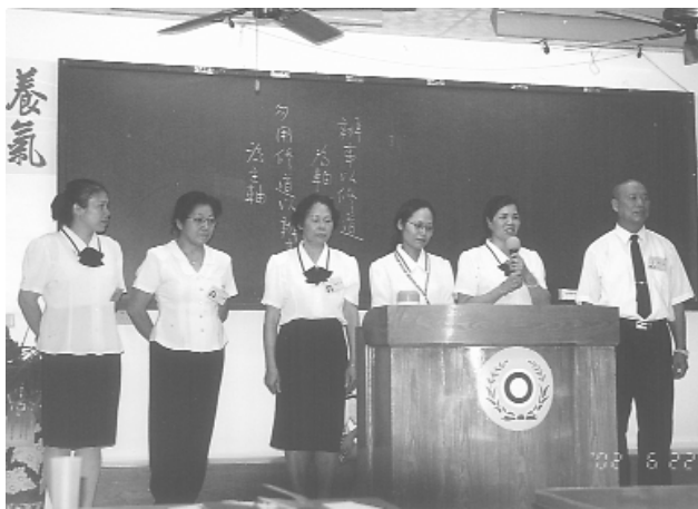
即興演講—腦力激盪。