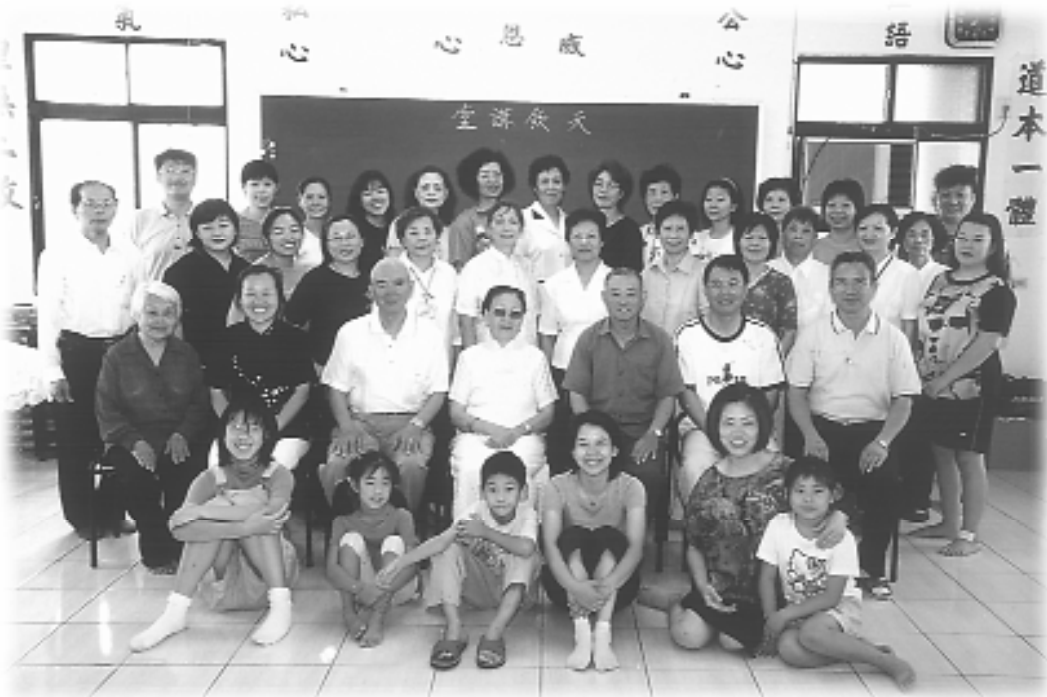
台東天欽講堂，度過感恩之夜。

道親有這樣的胸襟吧！「大家的真情、真誠，令她感動不已！一路上哭了又笑，笑了又哭，看到各位學長這麼用心，她說：「我們也要更精進，我愛你們！不論是在世界各個角落，大家都是家人！」