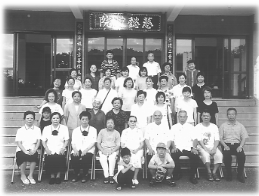
慈懿道院二日遊讓大家洗滌身心！

灣，值得一遊。來到紫熹山莊，採用古代中國式建築，古董、木雕、台灣特有檜木原木套房，具闢氣之美。午餐後，品嚐福祿（鹿）茶，這兒近鄰紅葉峽谷、溫泉，聞名的紅葉（國小）少棒紀