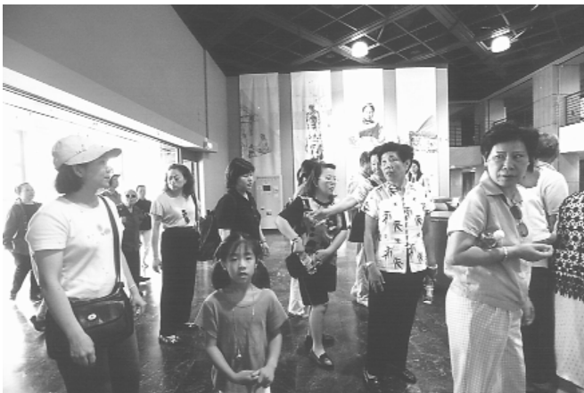
走訪國立史前博物館！

員中有很多是在國外結的緣，很少回到國內，更少接觸道場。自己本壇不用說，沒有想到到各道場，包括別組線道場，他們的熱情、熱誠、盛情接待，是超過大家想像的。因為在國外是比較個人主義，凡事都是自己來，這樣的接待，我們何德何能！受到這麼多的愛！包括青少年部分，也能夠體會得到，大家對他們的好，受到非常多的照顧，相信這也是大家對海外道場的期望，大家都希望我們任何人能把道務推展出去，道親們就是那股熱忱！把最好的掏出來給我們！把這股力量帶回去給當地其他人，讓我們深深感受：道親就是道親。 在一貫道總會底下，大家是這麼團結，不分