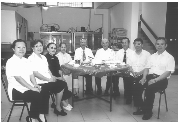
在高雄明德道院，二位前人（左四、五）親自接待。

途經太麻里，海岸山脈雄壯的美景漸漸遠離，隨著日落和時間消逝，燈火輝煌中，美麗的明德道院終於到了，幸逢開班時間，有幸聆聽林