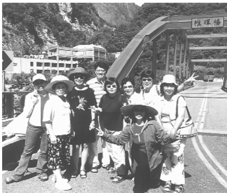
於天祥風景區雅暉橋留影。

轟隆的聲響，正在向我們招手！鯉魚潭旁鯉魚山，橫亙在中央山脈和海岸山脈之間的花東縱谷，是泛舟、划船的好所在，在這兒原住民的建築、圖騰歷歷可見，美麗烙印，誰說我們不是進入了原住民的版圖中？