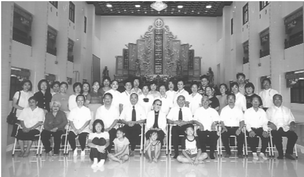
「義和聖堂」中莊嚴聖潔的聖堂。