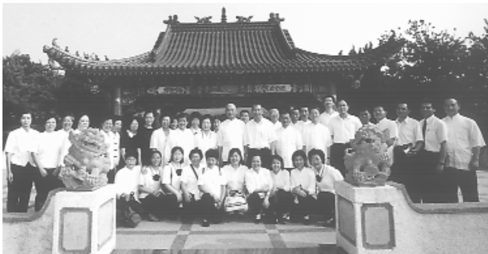
全體於福山榮園合影。