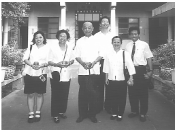
祖師祠前，人手一顆蘋果——「平安果」。

庫上游汲水區呈現旱災的景象：水庫缺水，大地乾涸、龜裂，惋惜著大地受傷了！彷彿在說：我好渴！！農業是這裡的主體，泰雅族人多採半穴居住，山葵樹處處可見。車子漸行漸遠，經過霧社事件、抗日紀念碑、人止關，靜靜憑弔這段歷史。