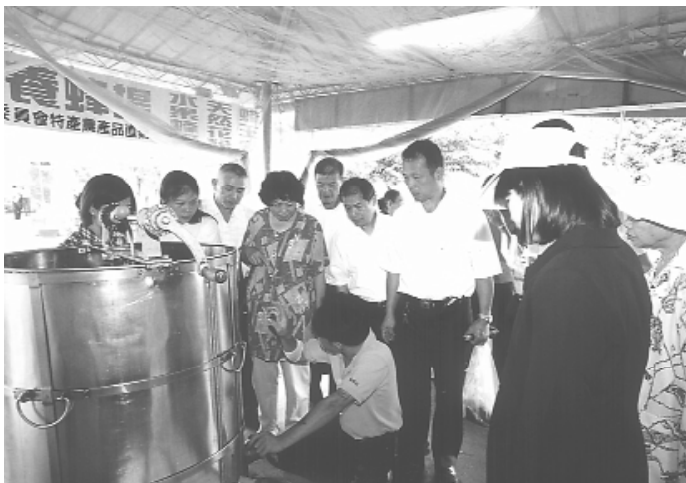
參觀養蜂場，製造蜂蜜過程。

的心，點傳師講是盡點傳師的心，人生歲月不多，要與時間賽跑，分秒必爭，只是把握有限時間，盡我的心而已。」身為老前人的後學，大家都很感恩，辦道的精神是無時無刻！老人家對師尊師母的敬重，想