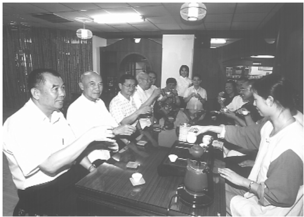
鹿谷茶香，回味無窮。

很容易進入我們的腦海中。頂級的鹿谷凍頂茶，享有全國的知名度，造成鹿谷鄉四千多位茶農茶商，雨露均霑的榮景，茶鄉的山谷空曠宜人，孕育出的好環境。